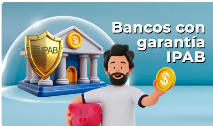
Última actualización 26 de septiembre de 2024.

Instituto para la Protección al Ahorro Bancario | 26 de septiembre de 2024